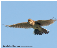
Songlerke. Nær trua.