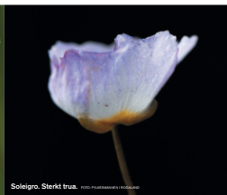
Soleigro. Sterkt trua.