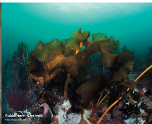
Sukkertare. Nær trua.