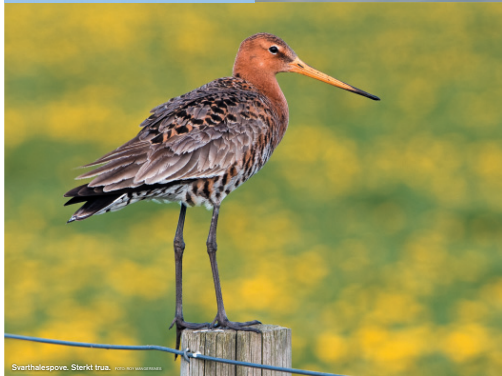
Svarthalespove. Sterkt trua.