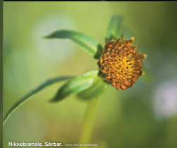
Nikkebronsle. Sårbar.