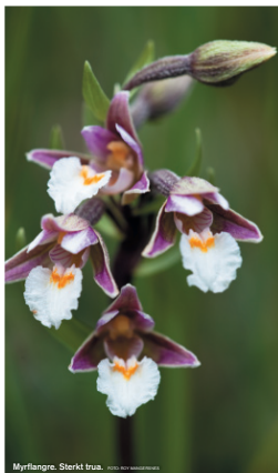
Myrflangre. Sterkt trua.