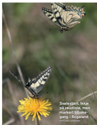
Svalstjernt. Ikkje på raudlista, men markert tilbakegang i Rogaland.