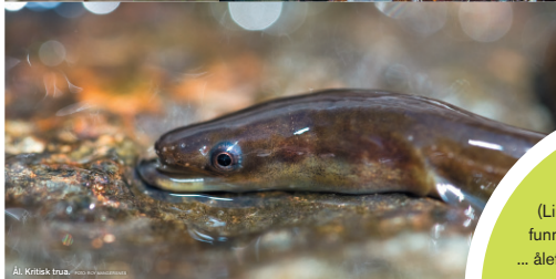
Ål. Kritisk trua.

Helseattesten til norsk natur heiter Norsk Raudliste. I gjeldande raudliste frå 2006 vurderte ekspertane tilstanden til 18 500 artar i norsk flora og fauna. Omlag 20 prosent av artane blei ført opp i raudlista. Av desse blir 1988 artar rekna som trua. Nasjonal raudliste skal oppdaterast i 2010.