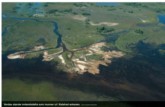
Verdas største innlandsdelta som munner ut i Kalahari-ørkenen.

Nasjonalpark oppretta i 1969 ved utlaupet av elva Guadalquivir på sør-vestkysten av Spania. Deltaområdet på 507 km 2 er ein særst viktig overvintringsstad for ender, gjess og andre vassfuglar. Området er truga av forureiningar frå gruvedrift lenger oppe i elva.