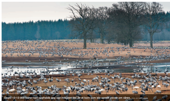
Opptil 12-13 000 traner kan opphalde seg ved innsjøen der dei et korn som blir spredd utover om våren.

Okavango i Botswana er verdas største innlandsdelta med eit særst rikt dyre- og planteliv. Her fins mesten 150 pattedyrartar, over 150 krypdyrartar og meir enn 500 fugleartar. I viltreservata kan ein mellom anna sjå løver, elefantar, flodhestar, sjiraffar og nilkrokodillar.