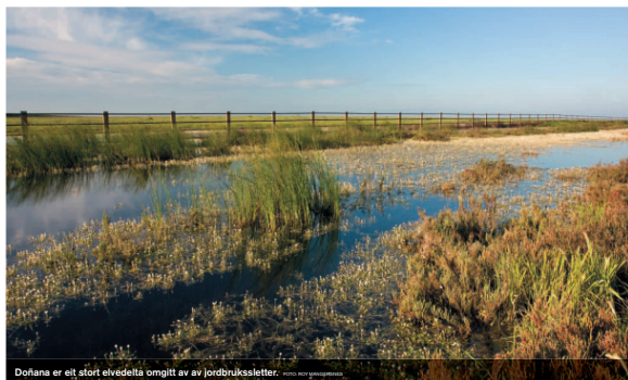
Doñana er eit stort elvedelta omgitt av jordbruksletter.