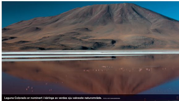
Laguna Colorado er nominert i kåringa av verdas sju vakreste naturområde.

Ein av Europas viktigaste våtmarker, særleg kjent for tusenvis av traner som raster her om våren på veg til hekkeområda. Eit 50-tals våtmarksartar hekker i og ved den grunne innsjøen. Dette naturreservatet ligg 15 mil nord-aust for Göteborg, og omfattar innsjø og strandenger på i alt 40 km 2 .