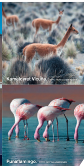
Kameldyr i Vicuña.