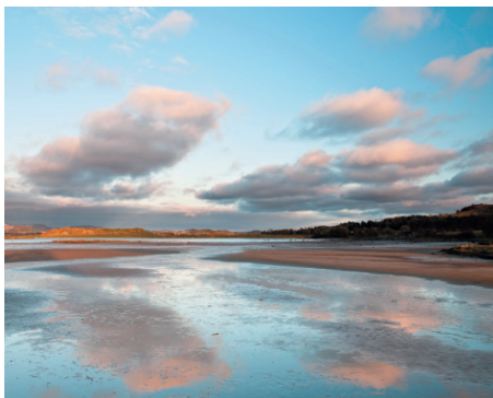
Hagavågen er ein av fleire grunne sjoområde i Hafslvsfjord som er viktige rasteplassar for fuglar under vår- og hausttrekk. Naturreservat med RAMSAR-status siden 1985.