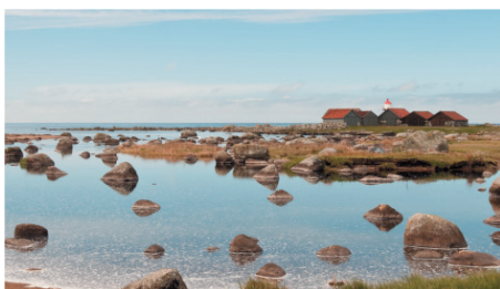
Ved høgvatn strøymer saltvatn inn i Håelva sitt vide uttaup og tilfører elva næringsstoff. I elvemunningen er det eit rikt dyre- og planteliv. Området er landskapsverna med fuglefredning.