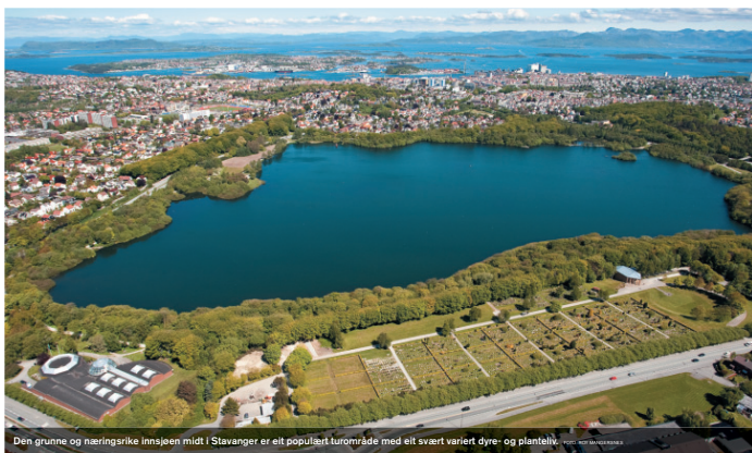
Den grunne og næringsrike Innsjøen midt i Stavanger er eit populært turområde med eit svært variert dyre- og planteliv.